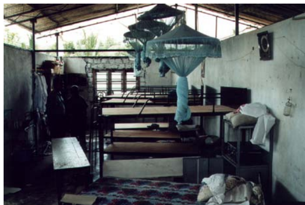
jongensslaapzaal Kumbukkana D&B School

Aan het einde van het jaar zal ook de stichting weer deelnemen aan een nieuwe actie van Mondial Apeldoorn en Wilde Ganzen.